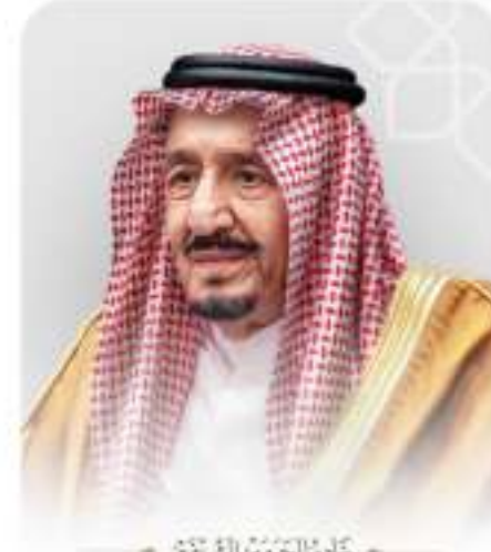
فهد بن سعود الملك سعود بن عبدالعزيز آل سعود

إن وطننا الغالي الذي انطلق منه الإسلام واضيئت منه أنوار النبوة سيظل متمسكاً بثوابت الدين الحنيف دين الوسطية والاعتدال