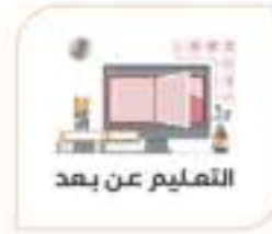
التعليم عن بعد