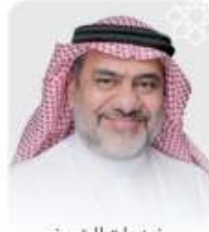
فضيلة الشيخ خالد بن رميح الرميح نائب رئيس مجلس الإدارة