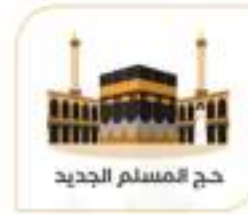
حج المسلم الجديد