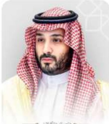
محمد بن سعود محمد بن سعود بن عبدالعزيز آل سعود

إن وطننا الغالي الذي انطلق منه الإسلام واضيئت منه أنوار النبوة سيظل متمسكاً بثوابت الدين الحنيف دين الوسطية والاعتدال